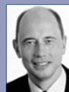
Wolfgang Tiefensee Bundesminister für Verkehr, Bau und Stadtentwicklung, Berlin