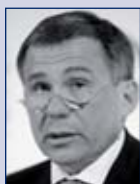
Rustam Minnikhanov Premierminister, Republik Tatarstan, Kasan, Russland