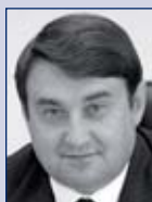
Igor L. Levitin Transportminister der Russischen Föderation, Moskau, Russland