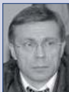
Ildus Faskhutdinov Transportminister, Republik Tatarstan, Kasan, Russland